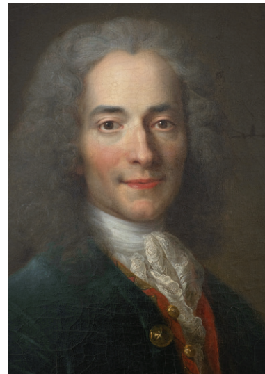
Nicolas de Largillière, portret al lui Voltaire în anul 1718, detaliu

Candide sau Optimismul (1759) este o carte satirică și polemică scrisă de Voltaire, care a dorit să denunțe anumite mentalități și instituții (Inchiziția, de pildă). Călătorind prin diverse locuri, Candide , protagonistul, își schimbă concepția despre lumea în care trăiește, socotită de profesorul său a fi „cea mai bună dintre lumile posibile”. Ororile pe care le observă (crime, abuzuri de tot felul, agresiuni etc.) îl pun pe gânduri. Teoria profesorului său (Pangloss), promovată de Leibniz, este demontată de însăși viața plină de nedreptăți, alcătuită strâmb. Tânărul își găsește, în final, refugiul în muncă, năzuind la „cultivarea propriei grădini”. Cartea este, dincolo de aventurile propriu-zise, o meditație pe tema unei lumi nedrepte și a iluziei fericirii.