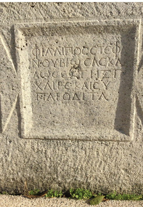
Ruine din cetatea Callatis (Mangalia, azi)