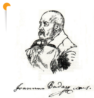
Ion Budai-Deleanu (grafică)

Ion Budai-Deleanu (1760–1820), poet și filolog. Studiază la Blaj, apoi urmează, la Universitatea din Viena, cursuri de filozofie și teologie. Devine bursier al Colegiului greco-catolic „Sfânta Barbara” din capitala Imperiului Habsburgic. Se stabilește la Lemberg (azi – Liov/Lvov, Ucraina), unde își continuă, pe lângă activitățile administrative (consilier aulic, judecător la Curtea de Apel), și munca de filolog. Tipărește, la Viena, prima gramatică a limbii române (alături de Samuil Micu și Gheorghe Șincai). Scrie și opere literare. Capodopera sa este Țiganiada , o „jucărea”, cum o numește autorul însuși, marcată de idei ale Iluminismului european (curent care a pătruns ușor în Transilvania). Compusă în două variante (1800 și 1810), Țiganiada – care s-a bucurat de o glorie postumă – este o epopee eroi-comică, remarcabilă atât prin subiect, cât și prin limbaj și inovații (notele de subsol). Ion Budai-Deleanu este, de asemenea, unul dintre cărturarii de referință ai „Școlii Ardelene”.