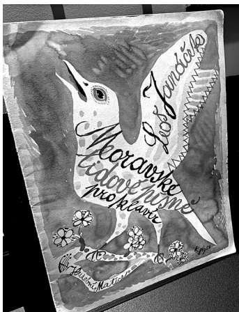
Leoš Janáček, cântece populare morave pentru pian

Și, în ziua aceea, Kundera revine la ceea ce numește el „prima dragoste“, compozitorul ceh Leoš Janáček. Povestește sfârșitul lucrării Vulpea cea șireată , „cea mai nostalgică dintre toate operele compozitorului“ 6 . Creată în 1925 la Brno, orașul lui natal, din Moravia. Cu exact patru ani înainte de a se naște Milan. O lucrare care l-a emoționat mereu. O operă magistrală despre trecerea timpului și despre prostia umană.